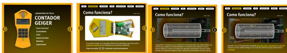
Figura 2: tela da mídia desenvolvida

Usando uma mídia interativa mostramos o funcionamento do contador Geiger e fizemos uma abordagem sobre os conceitos de radiação, para que os professores das diversas áreas pudessem se inteirar sobre o tema. A seguir apresentamos algumas telas da mídia desenvolvida como suporte para a abordagem do tema: